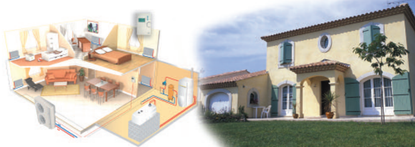
Exemple de configuration

Aqualis caleo produit seule la chaleur nécessaire tout au long de l'année, même par grand froid.